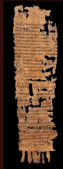
Papyrus Lille 79, coll. IPEL, Palais des Beaux-Arts, Lille