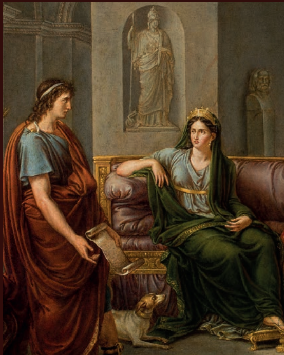
Extrait du tableau J.-B. J. Wicar, Virgile lisant l'Énéide devant Auguste et Livie (1 er quart du XIX e s.), Palais des Beaux-Arts, Lille (P.442) © Th. Nicq.

vendredi 16, samedi 17 mai 2014 salles F0.41 / F0.13 - Maison de la Recherche - Lille 3