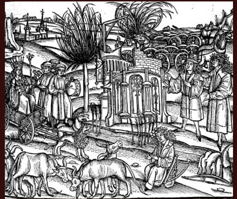
Virgile, Opera , Argentinae, 1502, éd. S. Brant, p. LXXXIII, source : bnf.fr.

Journées d'agrégation et de recherche organisées par J.-Ch. Jolivet, Fl. Klein, S. Tarantino